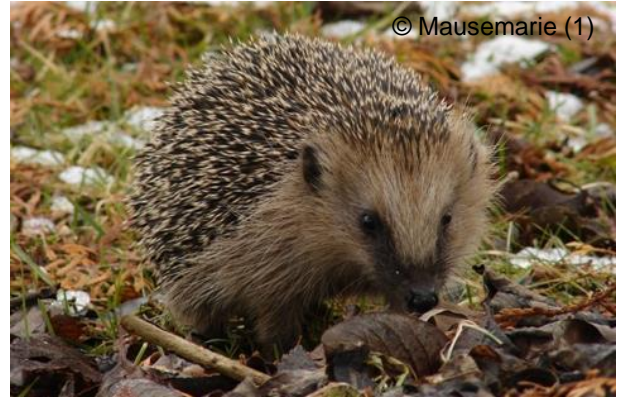
Igel brauchen eine mit Laub gefüllte Kammer im Holzhaufen, die für einen Fuchs unzugänglich ist.