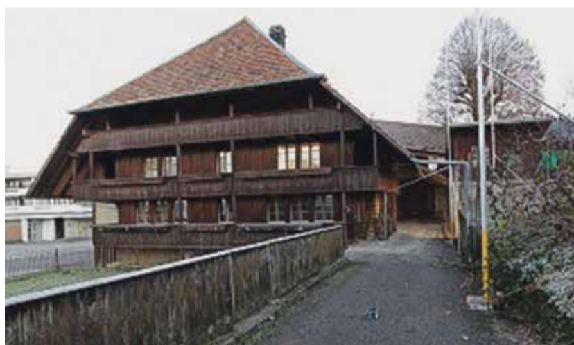
Abb. 1. Die Fassade des Aebersoldhauses (Baujahr 1740) in Rüfenacht wurde in den 1980er Jahren erneuert. Blick nach Norden.