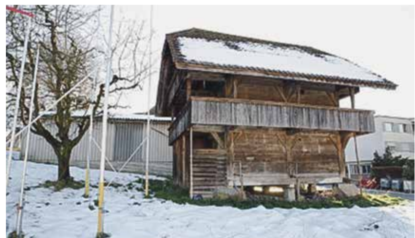
Abb. 2. Der Kornspeicher (Baujahr 1769) zum Aebersoldhaus wurde 1966 an diese Stelle versetzt. Die drei Lagerböden sind ostseitig über Treppen erreichbar. Blick nach Süden.