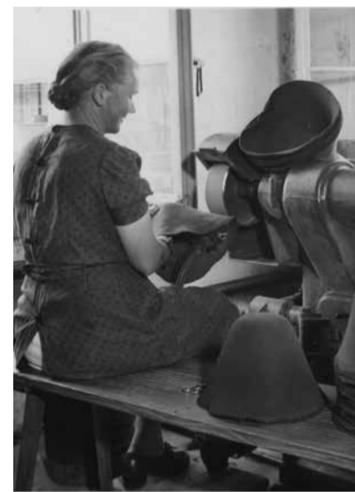
Fabrikation von Hutstumpen in Enggstein (undatierte Foto, wohl um die 1940er Jahre).

Trotz der Sanierungsmassnahmen verschlechterte sich die Lage ab 2000 weiter. Wichtige Kunden kamen ins Trudeln, einzelne wie die Ascom verschwanden sogar. Während das Auslandsgeschäft einigermaßen stabil blieb oder sogar florierte (Türkei, Ungarn, Slowakei), brach das Schweizer Geschäft sukzessive weg. Zudem belasteten neue Umweltschutz-Vorschriften der EU und des Kantons Bern die Rechnung. Die Firma geriet mit Zahlungen immer mehr in Verzug. Der Mitarbeiterbestand sank bis 2010 auf 28 Personen.