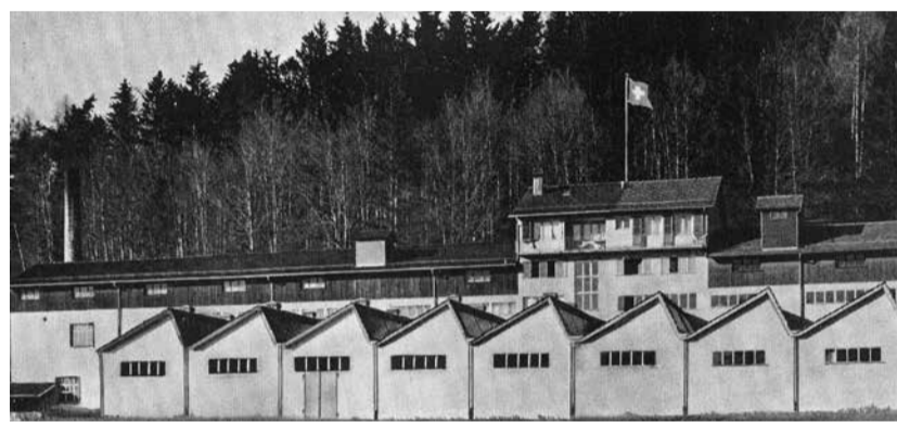
Die 1938 eingeweihte Filzfabrik in Enggstein mit dem Sheddach (um 1955). Die schräg gestellten und verglasten Dächer erlauben einen maximalen Lichteinfall in die Produktionshalle.