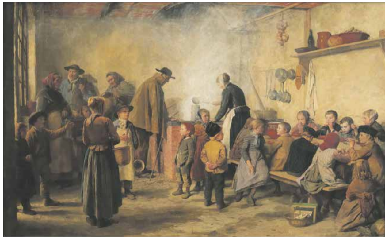
Albert Anker (*01.04.1831, Ins, †16.07.1910, Ins), Die Armensuppe in Ins II, 1893, Öl auf Leinwand, 85 x 137 cm Kunstmuseum Bern, Staat Bern

Die privilegierten Dorfoberen strebten danach, ihre Macht und Profitancen zu vergrössern. Sie entzogen der störenden Konkurrenz schleichend den Zugang zu Schlüsselämtern und hielten einen wachsenden Teil der Gemeindevölkerung in einer minderprivilegierten Stellung. Um aber der Machtentfaltung einige Privilegierten