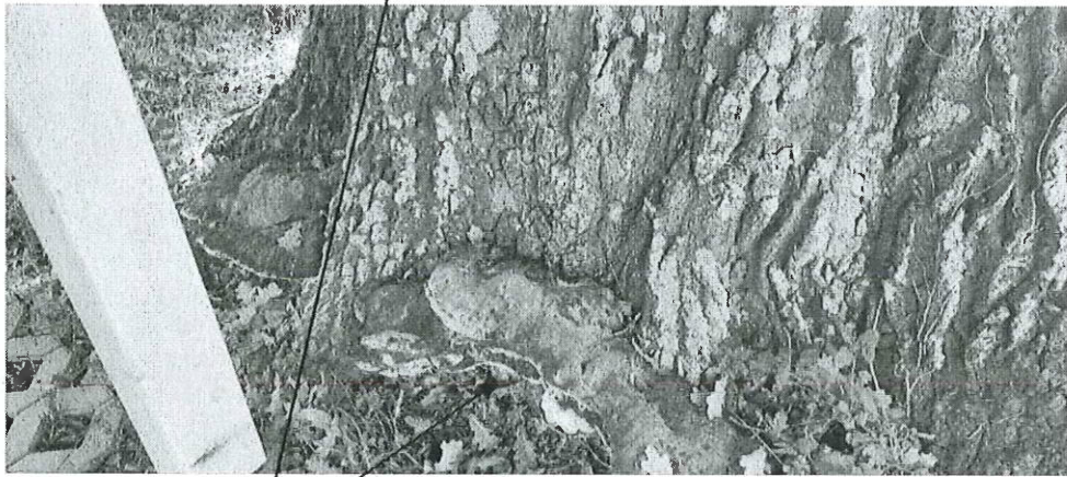
Pilzfruchtkörper um den ganzen Stammfuss des Tropfender Schillerporlings