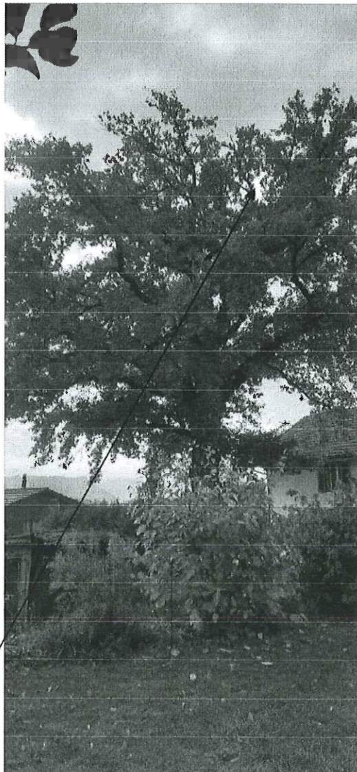
Sehr stark verlichtete Baumkrone der Eiche