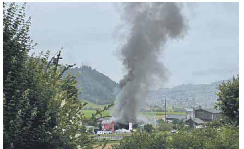
Brand in der Neuen Auto Worboden: Die schwarze Rauchwolke war weithin sichtbar.