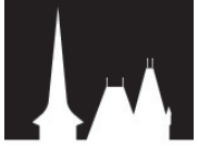
INTERESSENGEMEINSCHAFT WORBER GESCHICHTE

Der Artikel zum Armeestab 1940/41 in Worb und der Aufruf an die Zeitzeugen, sich zu melden, lösten einiges Echo aus. Zwei Zeitzeuginnen berichten von jener gefährvollen Zeit und eine wieder entdeckte Inschrift erinnert daran, dass Worb in jenen beiden Jahren ein «Hotspot» der Schweizer Geschichte war.