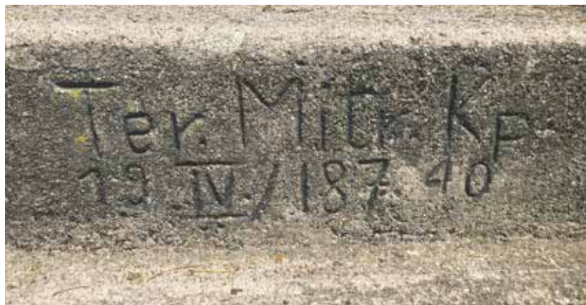
Inschrift der Territorial-Mitrailleurkompanie IV/187 auf der Treppe, die vom Brauereiareal zum Zelgweg führt.

che, wie Bluette Lauener-Wyss und Erich Müller übereinstimmend berichten. Seite 9 MARCO JORIO