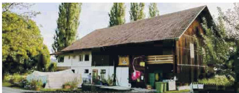
Seit Juli 2021 vollständig im Besitz der «radiesli» GmbH, der Hof in der Bodengasse.