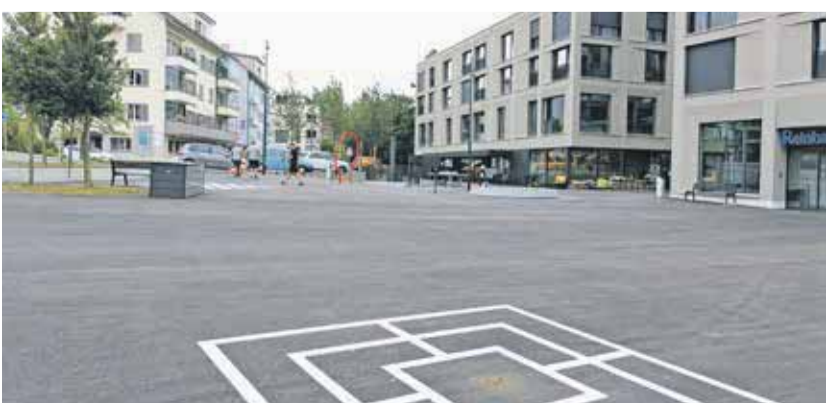
Am 11. September 2021 wird der Dorfplatz eingeweiht.

Neuer Showroom von Stucki Küchen AG in Rufenacht