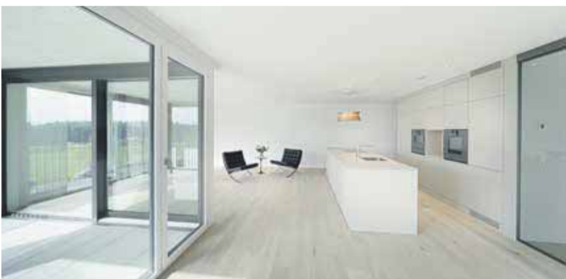
Zwischen April und August 2021 werden die Wohnungen übergeben.