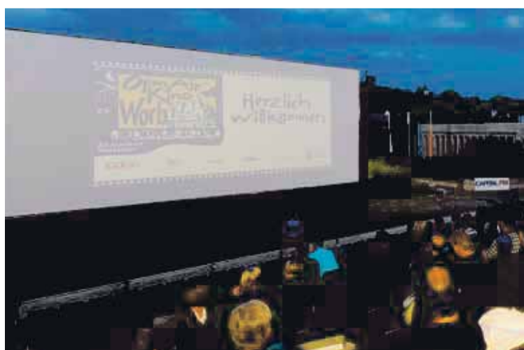
Der kulturelle Sommer: Das Worber Open Air Kino litt unter Regen und Kälte (Seite 7).