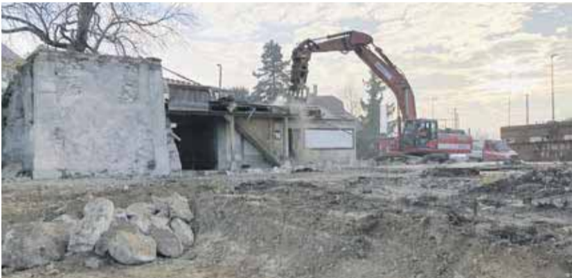
Nach der Erteilung der Baubewilligung starten am 12. November 2018 die Abbrucharbeiten. Bild: r + st architekten