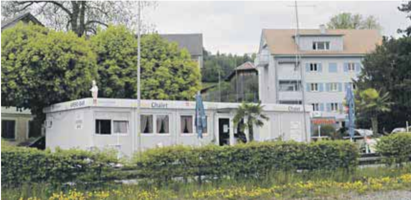
Von 2013 bis 2018 befindet sich auf der Brache eine temporäre Apéro-Bar, das «Sonnen-Chalet». In einem sogenannten Werkstattverfahren können sich Interessierte einbringen. Das Bauprojekt wird erarbeitet.