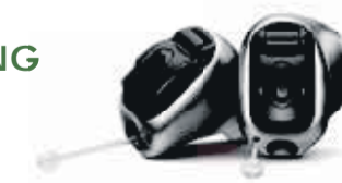
Phonak Virto™ B-Titanium