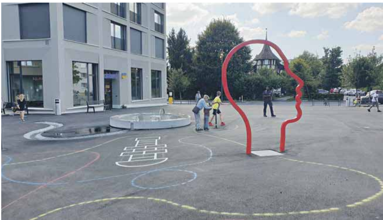
Der rote Kopf soll zum Denken und Diskutieren anregen.

überlegt, was es sein soll. Nun habe er ein Objekt gefunden, das generationenübergreifend funktionieren kann. «Die Mutter kann mit ihrem Kind ebenso darüber diskutieren wie sich ein 90-Jähriger dazu Gedanken machen kann. Der rote Kopf ist Kunst für alle Alterssegmente.» Am 11. September wird das Kunstwerk sicherlich Teil der Diskussionen sein. Fürs grosse Fest ist soweit alles bereit. Die Verantwortlichen hoffen nun einzig noch auf schönes Wetter! CK