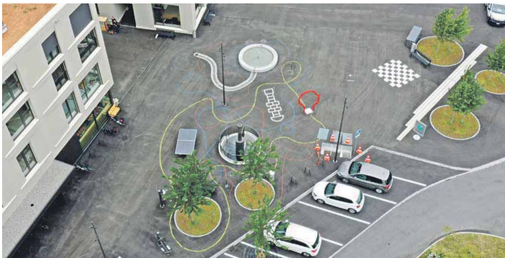
Der neue Dorfplatz beim Zentrum Sonne Rüfenacht.