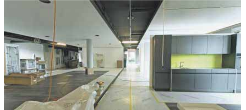
Die Fertigstellung des neuen Showrooms verzögert sich.

es nicht nur um den Umsatz. Diesen wollen wir von aktuell rund sieben auf zehn Millionen steigern. Dafür braucht es mehr Personal. Ich will den Bestand um fünf bis zehn Personen erhöhen. Wir haben aktuell eine Grösse, wo wir teilweise grosse und teure Maschinen benötigen, unabhängig davon, ob wir sieben oder zehn Millionen Umsatz machen. Mit dem Wachstum wollen wir der Konkurrenz aus dem Ausland die Stirn bieten. Je grösser man ist, desto grösseres Gewicht hat man beispielsweise beim Einkauf. Ziel ist es, uns im mittleren/höheren Preissegment besser zu etablieren und vermehrt überregional tätig zu sein. Die neue Ausstellung soll einen Leuchtturmeffekt haben in Richtung Seeland, Deutschfreiburg, Solothurn oder die Region Lyss, wo wir übrigens schon viele Kunden haben. In der Ausstellung soll unsere Kundschaft sehen, zu was wir fähig sind, und sich inspirieren lassen.