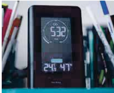
CO 2 -Messgerät im Klassenzimmer.

Die Qualität der Luft in den Klassenzimmern ist nicht erst seit der Corona-Pandemie ein Thema. Dass die ungenügende Belüftung die Konzentration erschwert und deshalb negative Auswirkungen auf den Lernerfolg hat, ist bekannt. In zwei von drei Schulzimmern ist die Qualität der Atemluft laut BAG-Studie von 2019 ungenügend. Durch die Pandemie ist das Thema in den Fokus gerückt, weil die schlechte Luftqualität in vielen Schulen auch die Gesund-