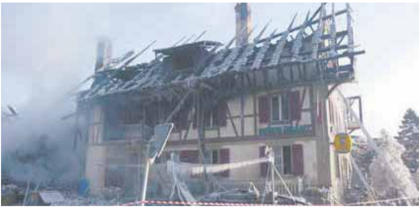
Am 6. Februar 2012 brennt der Traditionsgasthof «Zur Sonne» vollständig ab. Im September 2012 erwirbt Ramseier und Stucki Architekten AG das Land.