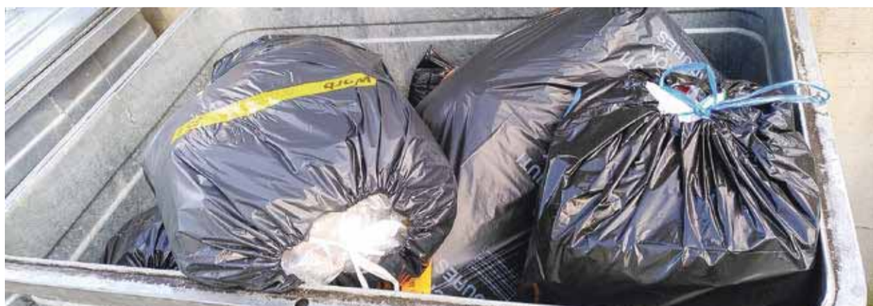
Alles Müll? Gut die Hälfte des Plastikabfalls kann wiederverwertet werden