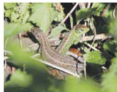
Zauneidechse: Weibchen (li), Männchen (re)

typische und ursprüngliche Art in der Gemeinde. Sie lebt an sonnigen Böschungen, Wegrändern, Bachufern, Waldrändern, in extensiven Weiden und leider immer seltener im Siedlungsraum.