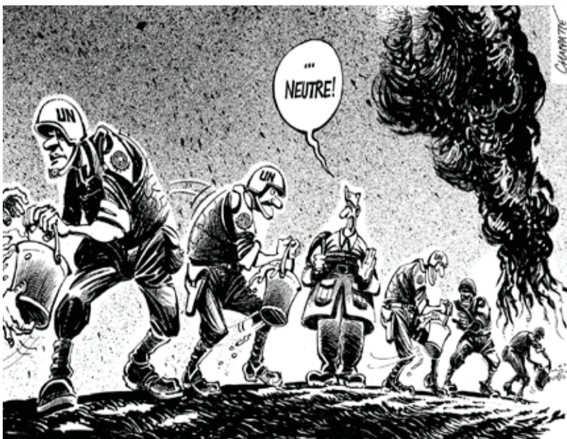
Der neutrale Schweizer Soldat verweigert seine Hilfe. 1994 lehnte das Schweizer Stimmvolk mit 57% die Schaffung eines UNO-Blauhelmkontingents ab. Der Zeichner Patrick Chappatte rückt das unsolidarische Abseitsstehen der Schweiz und damit diese Form der Neutralität in ein schlechtes Licht. Bild: Globe Cartoon 1994.