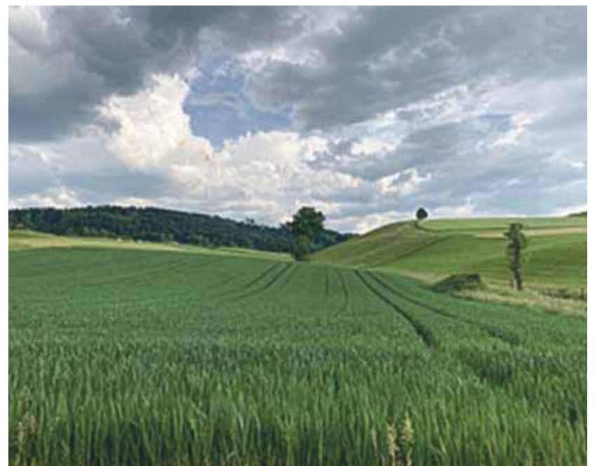
Literarische Wanderung ins Grüne.

Weitere Informationen: https://www.kob.ch/veranstaltung/buecherwandern-von-worber-nach-muensingen/