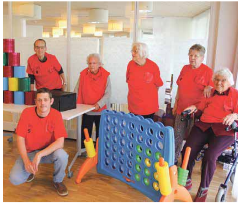
Bereit für die Olympiade – das Team vom Zentrum Alter Worb