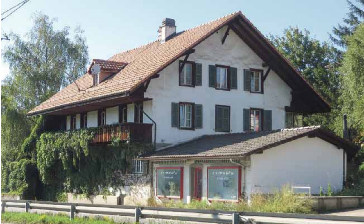
Einst Käselager, heute Künstleratelier, das Haus an der Dorfstrasse 10 in Rüfenacht.

Ein weiteres Stück altes Rüfenacht droht zu verschwinden. Das Haus an der Dorfstrasse 10, wo heute der Künstler Walter Geissberger alias «Capramontes» sein Schaulager hat, soll abgerissen und durch einen Neubau ersetzt werden. Dagegen regt sich nun Widerstand. Dem gegenüber stehen die Interessen der Gemeinde, die auf Investitionen in den Wohnungsbau angewiesen ist und der langsam das Bauland ausgeht.