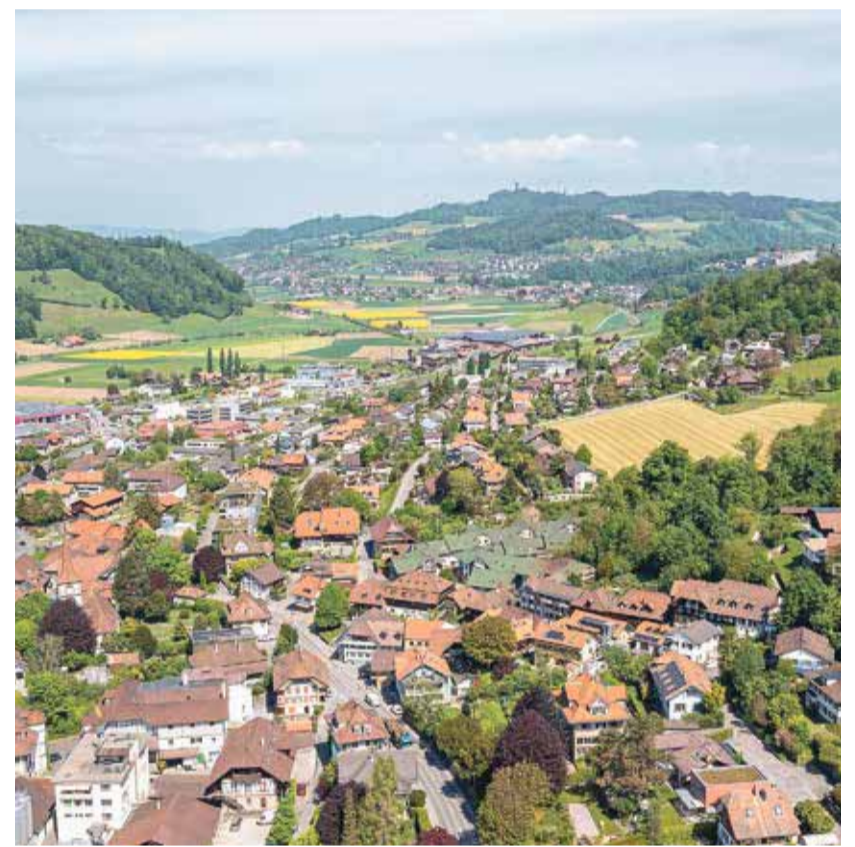
Entwicklung wie weiter. Worb muss seinen Richtplan neu überdenken.

Schaulagerbesuche können über capramontes@bluemail.ch vereinbart werden.