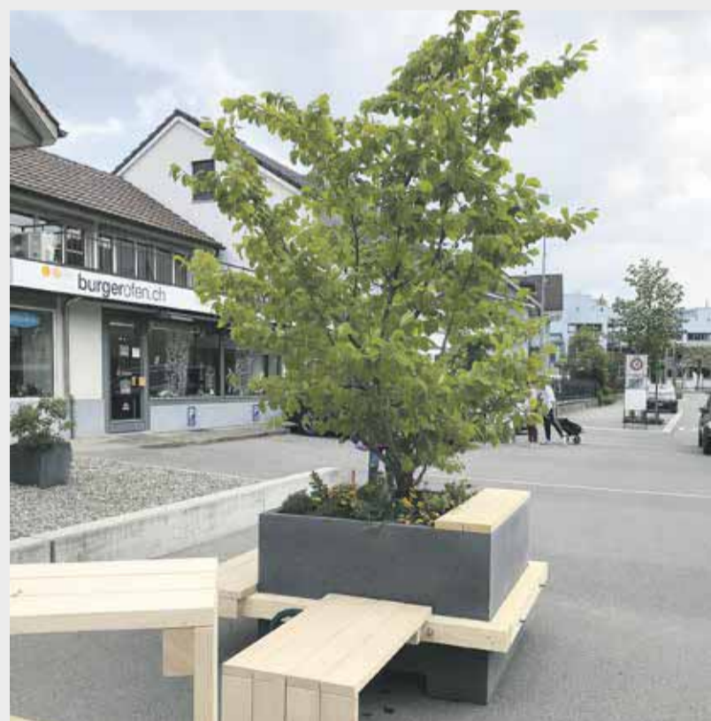
Die Schattenplätze sind am Mai wieder auf der Strasse.

Wir Frauen von «www – worb wie weiter» freuen uns auf regen Besuch und muntere Gespräche. WoPo