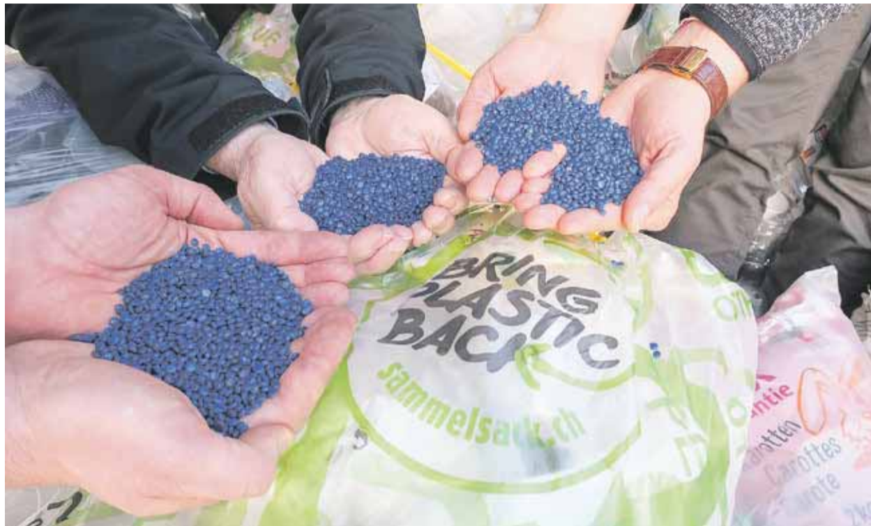
Das gesammelte Plastik wird von der InnoRecycling AG zu Regranulat verarbeitet.

Es ist schon längst nicht mehr aus unserem Alltag wegzudenken, das Plastik. Praktisch, leicht, vielseitig einsetzbar, und wie unvermeidbar es ist, stellt man spätestens beim Versuch fest, auf Kunststoffe im Alltag zu verzichten; Plastik ist überall. Dementsprechend hoch ist auch der Kunststoffverbrauch, allein in der Schweiz fallen jährlich pro Kopf rund 109 Kilo Kunststoffabfälle an, gut die Hälfte davon sind Verpackungen. Ausgangslage für Kunststoffe sind Kohlenstoffverbindungen, die aus Erdöl oder Erdgas, also nicht erneuerbaren Ressourcen, gewonnen werden, und auch sogenannte biobasierte Kunststoffe sind auf den zweiten Blick doch nicht so eine sinnvolle Alternative, da sie meistens aus Stärke hergestellt werden, die aus Mais oder Kartoffeln gewonnen wird und somit zur Konkurrenz für die Nahrungsmittelproduktion werden. Daher macht es Sinn Kunststoffe so lange wie möglich im Stoffkreislauf zu behalten und immer wieder neue Produkte daraus zu gewinnen. Bei den PET-Flaschen gelingt das schon recht gut, da beläuft sich die Recyclingquote um die 80%. Viel Raum gegen oben gibt es bei anderen Kunststoffprodukten, die Recyclingquote liegt da nämlich bei gerade mal 20%. In Bern soll sich das nun ändern, zusammen mit der AVAG Umwelt AG, der Kunststoff-