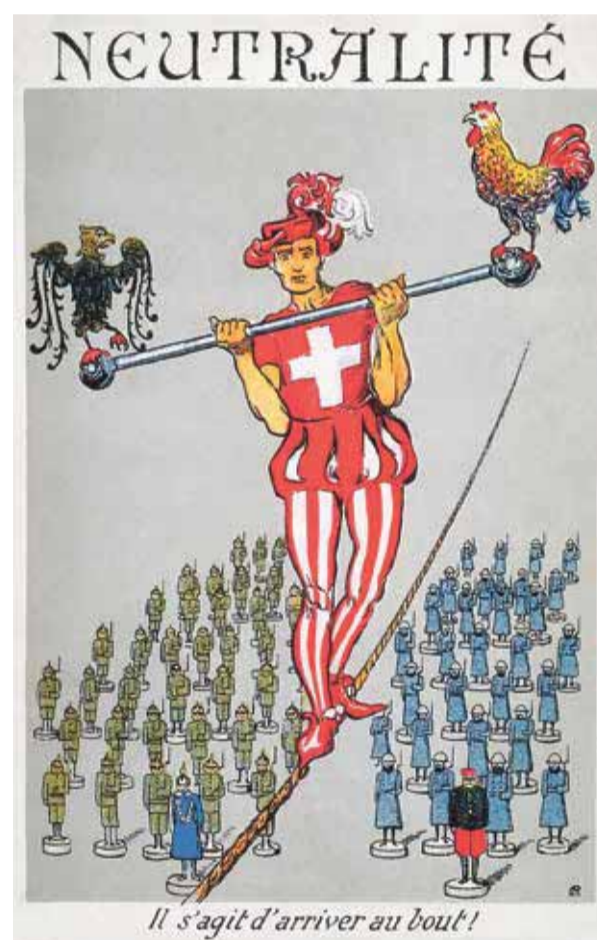
Der Alte Eidgenosse auf dem Hochseil der Neutralität balanciert 1915 über die beiden kriegführenden Armeen Deutschlands (mit Pickelhauben) und Frankreichs (mit den roten Hosen). Auf der Balancierstange haben sich der französische Hahn und der deutsche Adler niedergelassen.

Die erregten Neutralitätsdiskussionen der 1990er Jahre verstummten mit dem Beitritt der Schweiz zur UNO. Aber weder die Politik noch die Völkerrechtler rafften sich auf, eine Neutralität für das 21. Jahrhundert zu konzipieren. Und so stolperte die Schweiz mit einer überholten Neutralitätskonzeption in die von Putins Russland ausgelösten Krisen. Mit der russischen Aggression am 24. Februar 2022 zerplatzte die Illusion vom Ende der zwischenstaatlichen Kriege in Europa. Die Neutralität war wieder zurück. Mit ihrem rigorosen Waffenausfuhrgesetz handelte sich die Schweiz viel Ärger ein. Das heutige Waffenausfuhrverbot, das sogar weit über das rudimentäre Neutralitätsrecht von 1907 hinausgeht, ist eine schweizerische Eigenentwicklung und das Produkt eines pazifistischen und moralischen Mainstreams. Mit dem Festhalten an der obsoleten Haager Konvention von 1907, vor allem von Art. 9 (Gleichbehandlungsgebot bei Waffenausfuhr), sabotiert zudem die Schweiz den Art. 51 der UNO-Charta. Dieser gibt nur dem Opfer einer Aggression das Recht auf Krieg. Der Bundesrat und vor allem das Parlament praktizieren eine Neutralität, die dem heutigen Völkerrecht nicht entspricht, die Schweiz international isoliert und der Schweiz sicherheitspolitisch und reputationsmässig schadet. Es gibt keinen Grund, die Neutralität Hals über Kopf aufzugeben. Eine Neukonzeption auf der Basis der UNO-Charta ist jedoch dringend notwendig. MARCO JORIO