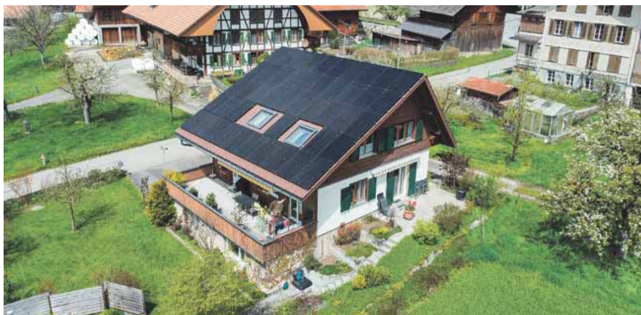
Photovoltaik-Anlage auf einem Richiger Hausdach.