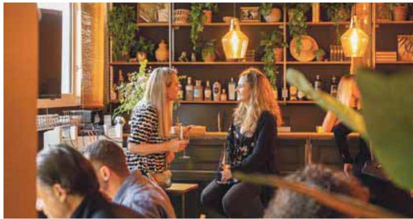
Momentaufnahme vom Einweihungsfest. Die Mietbar Nr. 5 kann ab sofort gemietet werden.

Am 17. Mai um 17 Uhr steigt auf dem Bärenplatz und im Bärensaal das «WorBär-Fest». Das Fest wird vom Verein «WorBär» organisiert zu Ehren des Holzbären, der 100 Jahre die Fassade des «Bären» an der Hauptstrasse zierte und nun als Denkmal im Foyer des Gemeindehauses am Bärenplatz stehen wird. MC