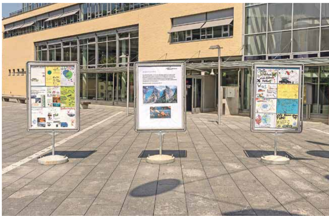
Derzeit auf dem Bärenplatz: Fakten zum Klimawandel und Tipps zu einem umweltschonenderen Lebensstil.