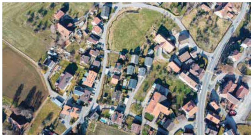
Richigen wird zum Solar-Vorzeigedorf.

plötzlich Vorreiter bei den erneuerbaren Energien in der Gemeinde. Die Worber Post hat Einblick bekommen in die Veränderungen und Herausforderungen des Dorfes und mit der Gemeinde über die Rolle gesprochen, die sie bei der Förderung und Unterstützung von alternativen Energien auf Gemeindegebiet zum jetzigen Zeitpunkt und zukünftig einnimmt. Seite 4 KS