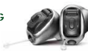
Phonak Virto™ B-Titanium

Hörberatung Worb Kreuzgasse 11 · 3076 Worb Telefon: 031 301 55 55