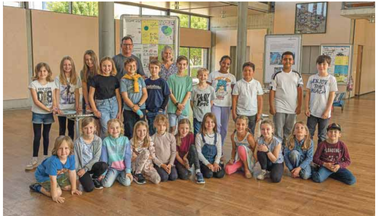
Krönender Abschluss des Schulprojektes: die Kinder vom Schulhaus Wyden beim Fototermin mit Worb's Umweltpolitischer Gemeinderat Adrian Hauser.