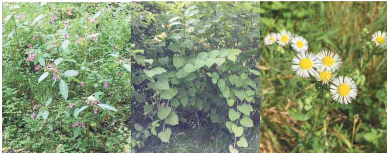
Fotos (v.l.n.r.): Drüsiges Springkraut, Staudenknöterich, Einjähriges Berufkraut.