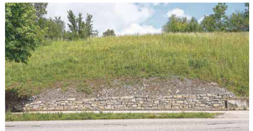
Noch ist bei der Trockensteinmauer an der Richigenstrasse nicht viel von der Bepflanzung zu sehen.

wie das Entfernen von Neophyten oder den Erhalt von Feuchtgebieten. Der Bau der Trockensteinmauer sei daher eine willkommene Abwechslung gewesen. AW