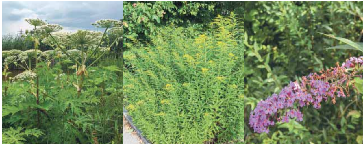
Fotos (v.l.n.r.): Riesensbärenklau, Kanadische Goldrute, Sommerpflöcker.