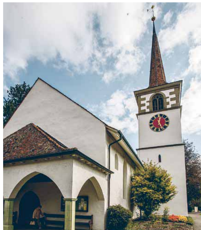
Die neugewählten Pfarrerrinnen sind ab September 2023 in der Kirche tätig.

Die Kirchgemeinde freut sich auf die Zusammenarbeit mit den Neugewählten und heisst sie herzlich willkommen. WoPo