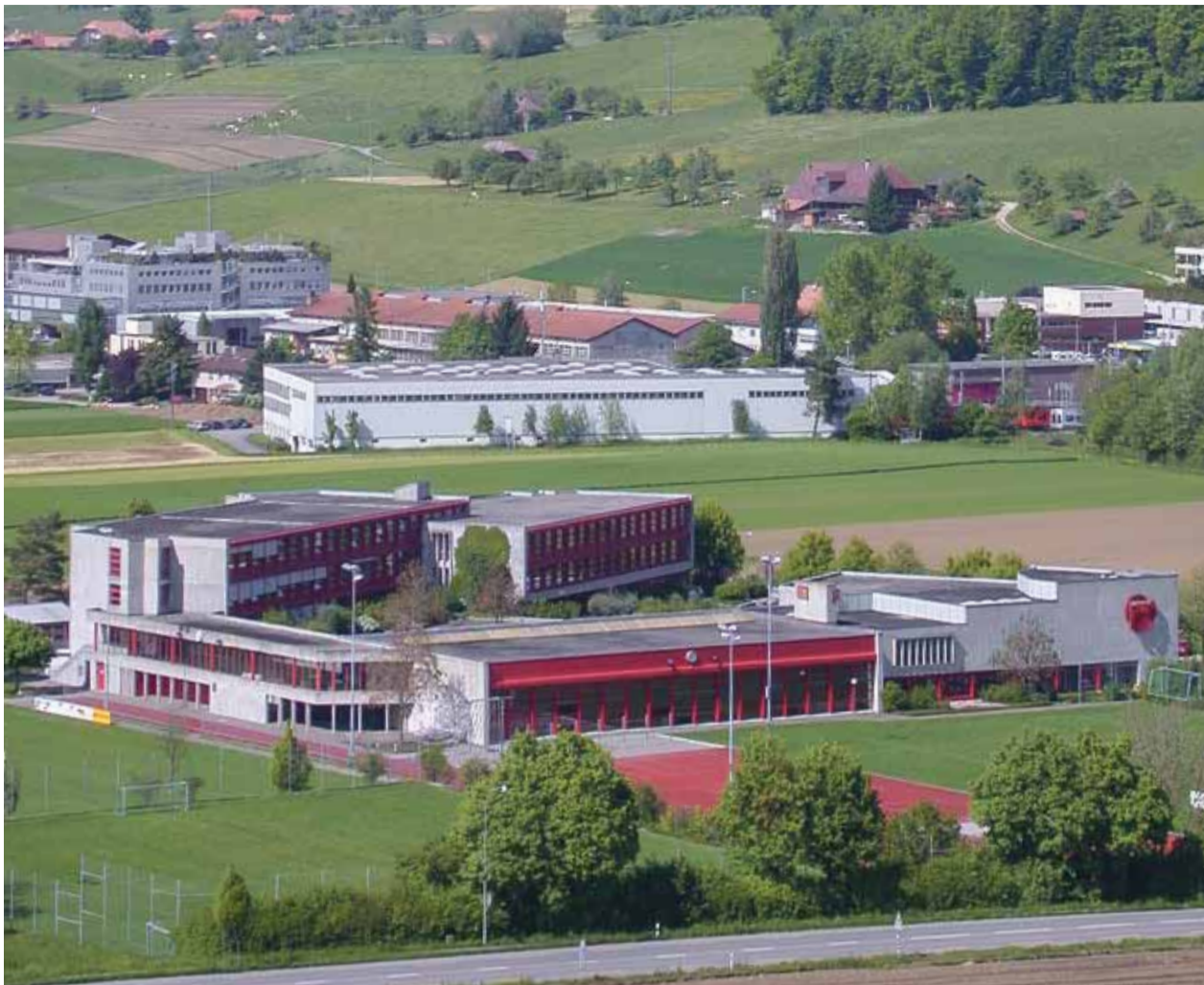
Im Oktober kommt der Kredit für die Gesamtanierung des roten Schulhauses an die Urne.