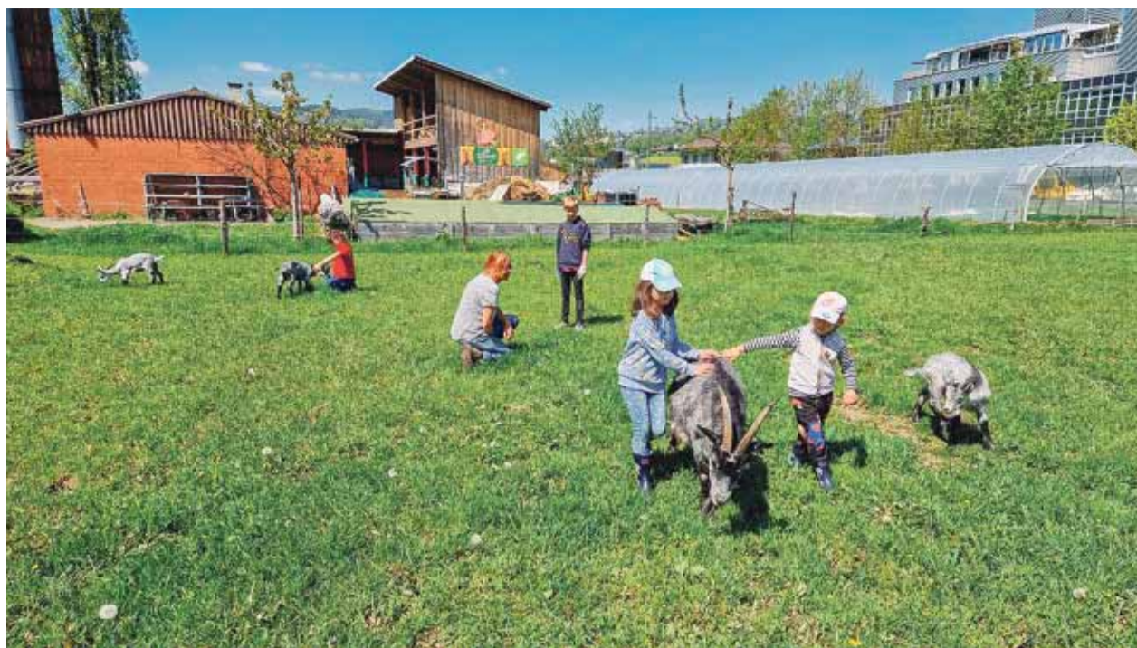
Die Hofkinder besuchen die Geissen.