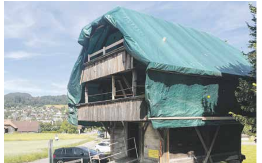
Noch steht der Spycher nicht an seinem finalen Standort.

In den vergangenen Jahren hat die Jugendarbeit, wie beispielsweise mit der Boulderhalle, attraktive Angebote für die jüngere Generation geschaffen. Mit dem Freizeitspycher folgt die nächste Entwicklungsphase. Was die Gestaltung des Aussenraums betrifft ist nun auch die Bevölkerung gefragt. Der Mittwirkungsprozess ist am vergangenen 13. Juni gestartet.