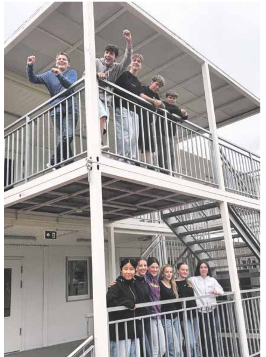
Auch im Provisorium gehen der Jugendredaktion die Geschichten nicht aus.