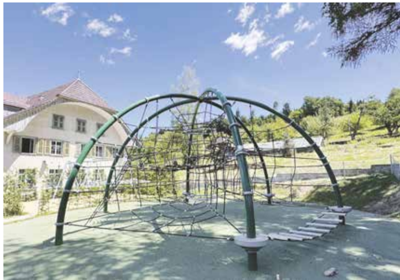
Der Spielplatz bringt ein Stück Normalität.