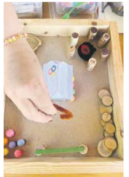
Erste Ideen für die Neugestaltung.

Mit dem Spycher als zentrales Element soll nun auch der Aussenraum beim Freizeithaus umgestaltet werden. Geplant ist ein öffentlich zugänglicher Treffpunkt für Jung und Alt zum Spielen und Verweilen. Das Erdgeschoss des Spychers soll dabei als Unterstand und Aufenthaltsort dienen, während die oberen Geschosse von der Jugendarbeit genutzt werden. Die Neugestaltung des Aussenraumes soll nun zusammen mit der Bevölkerung angegangen werden. Startschuss war die Ideenwerkstatt am 13. Juni 2026 beim Freizeithaus. Zusätzlich lief eine Online-Umfrage zur Neugestaltung des Aussenraumes. Weitere Beteiligungsmöglichkeiten sind nach den Sommerferien geplant. Der Ort soll gemeinsam entstehen und auf die Bedürfnisse der Menschen abgestimmt sein, die ihn nutzen. Um das Projekt abzuschliessen ist die Jugendarbeit auf Spenden angewiesen, denn noch steht der Spycher nicht an seinem finalen Standort. Das