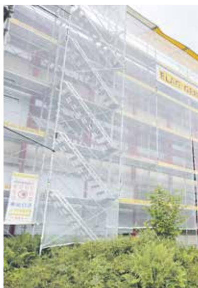
Die Rückbauarbeiten sind fast abgeschlossen.

Die Fassaden sind ebenfalls zum grössten Teil rückgebaut. Die Altlastensanierungen im Klassentrakt konnten bereits abgeschlossen werden. Auch die Betonsanierung konnte bereits aufgenommen werden. In den Sommerferien starten die Arbeiten im Bereich Aula und Turnhalle. AW