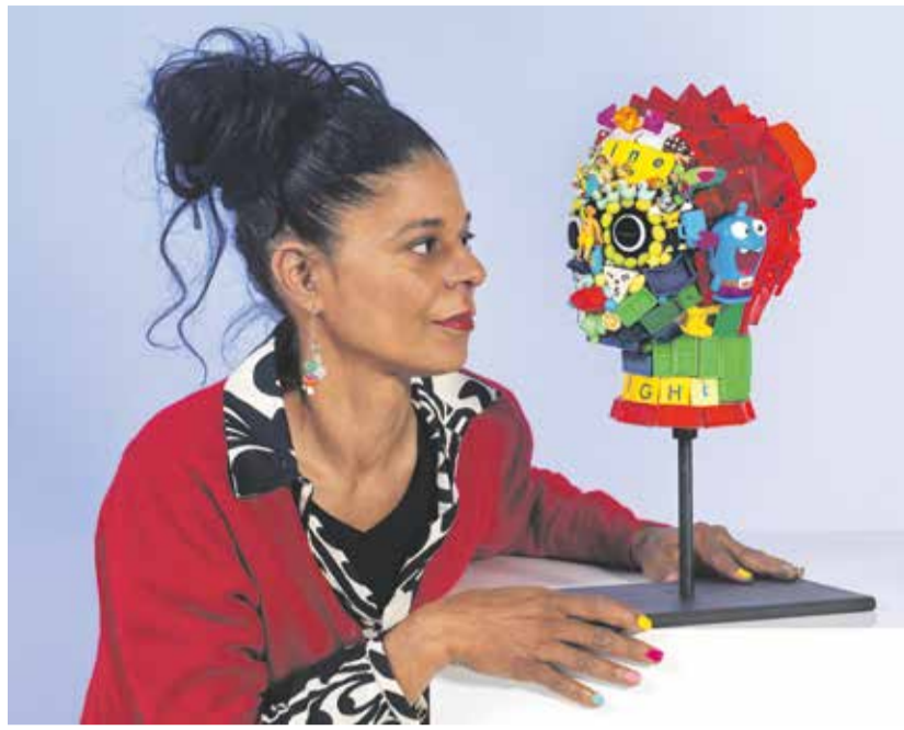
Upcycling-Kunst von Tamara L. Thompson.